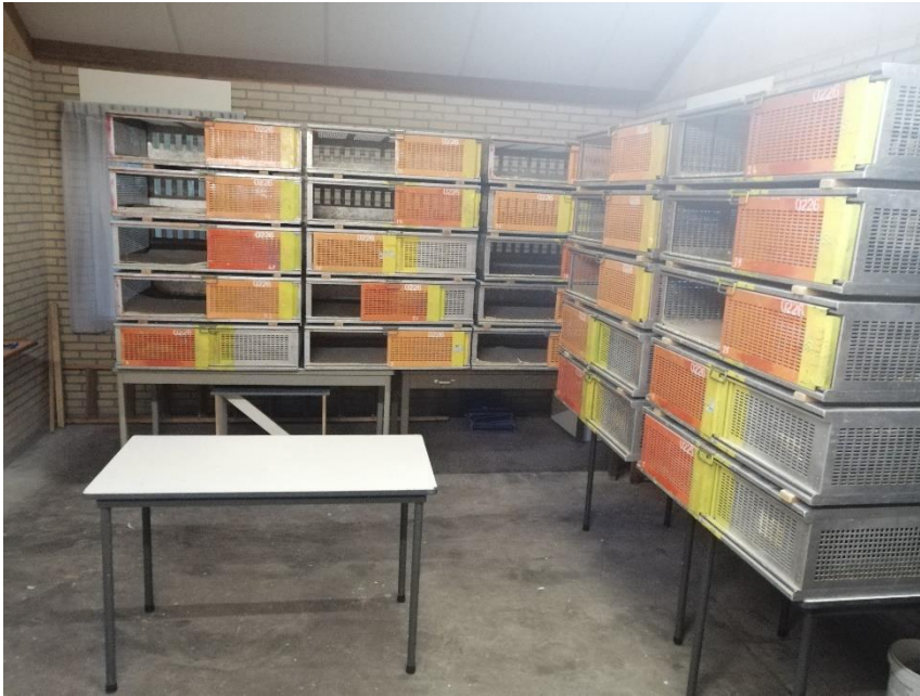
Afbeelding 1 Tafel bij de inkorfmanden, waar de duiven door de centrumleider opgezet worden, om vervolgens door de inkorfleider ingemand te worden.