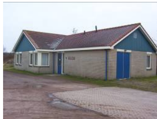
Het Nationaal Inkorfcentrum is te vinden op het industrieterrein "De Stikke" aan de T. de Boerstrijte 8d in Balk.